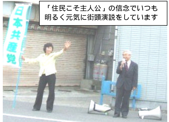
「住民こそ主人公」の信念でいつも 明るく元気に街頭演説をしています